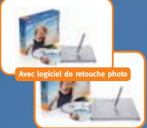
Avec logiciel de retouche photo

Contenu Studio, Tablette (env. 21 x 20 cm, surface active env. A6), Studio XL, Tablette (env. 26 x 28 cm, surface active env. A5), Stylet, guide de mise en route, CD-ROM contenant le pilote de la tablette et le manuel de l'utilisateur en ligne, CD-ROM contenant nik Color Efex Pro 2.0 Standard, CD-ROM contenant le logiciel Adobe Photoshop Elements