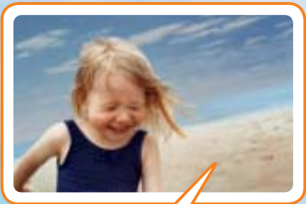
Foto original: Una fotografía maravillosa de su hija; lástima que el cielo parezca más oscuro de lo que realmente era.