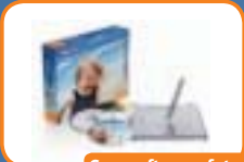
Con software fotográfico